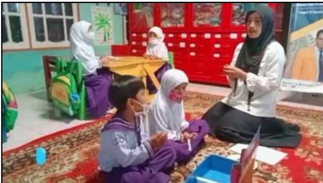
Gambar 2: Permainan Kotak Pintar dengan Media Tutup Botol