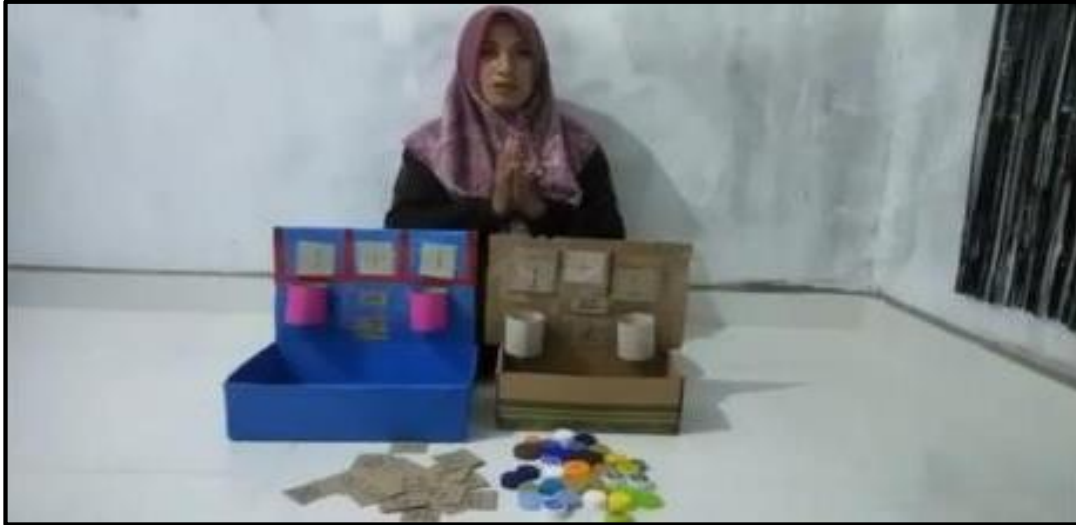
Gambar 1: Alat permainan Edukatif Kotak Pintar

Berdasarkan tabel diatas maka untuk meningkatkan kemampuan anak dalam mengenalkan konsep angka guru berupaya meningkatkan kemampuan anak dalam mengenal konsep bilangan melalui pengembangan “permainan kotak pintar”